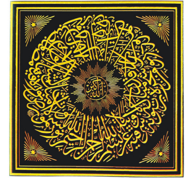
Айят Света. (Коран, XXIV, 35). XVIII в.

Это, прежде всего, тот факт, что любая мистическая философия представляет собой нечто, идущее после, но никогда не прежде, того всегда целостного опыта, который может быть назван опытом переживания Истины, опытом тотального приобщения к ней всего существа человека, в котором онтологический, гносеологический, этический или эстетический аспекты представляют собой всегда более или менее искусственно выделяемые задним числом грани некоторой целостности, некоторого единства, внутри которого все они переплетены и слиты, внутри которого можно говорить только обо всех их вместе, обо всех их сразу. Мистическая философия представляет собой попытку разговора a posteriori о таком целостном переживании, в котором оно по законам дискурса неизбежно дробится, неизбежно должно быть разложено на какие-то составляющие. При этом — и читатель должен всегда иметь это в виду — «за кадром», за