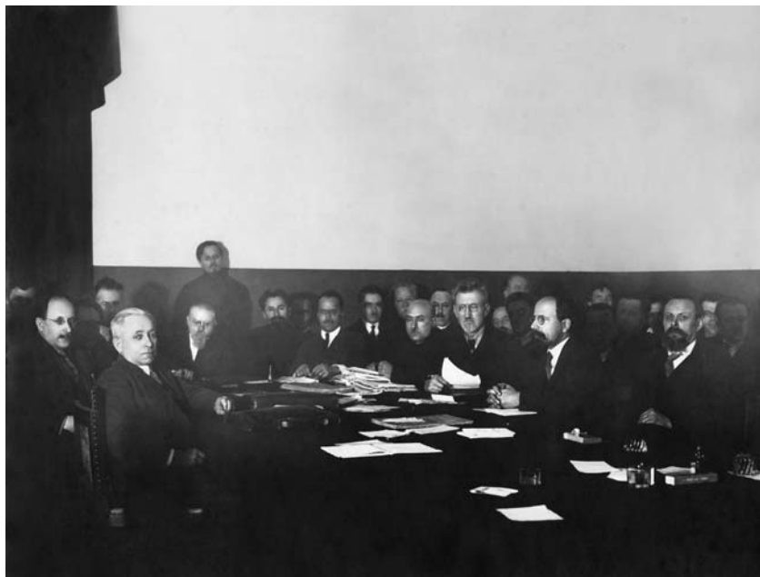
Заседание Президиума Академии наук во главе с М.Н. Покровским и В.П. Милутиным. Крайний слева – А.М. Деборин. Конец 1920-х годов

“изменническое”. Разрыв произошел в 1917 году, по возвращении Плеханова в Россию. Деборин вспоминал: «Мне больно было потерять Плеханова и как личного друга, и как одного из виднейших лидеров нашей партии. Г.В. Плеханов прибыл в Петроград и выступил на собрании Совета солдатских депутатов. Речь шла тогда о том, что солдаты не захотели пойти в наступление на немцев, в чем их “угovarивали” оборонцы, стоявшие за войну “до победного конца”. В качестве сторонника войны “до победного конца” выступил и Плеханов. Я стоял на трибуне рядом с ним и был потрясен, когда он призывал солдат к наступлению и одобрил наказание смертной казнью тем, кто в наступление откажется пойти. Прощаясь с ним после его выступления, я совершенно откровенно высказал ему свое возмущение, а он меня обозвал “предателем”. С тех пор мы больше не встречались» 8 .