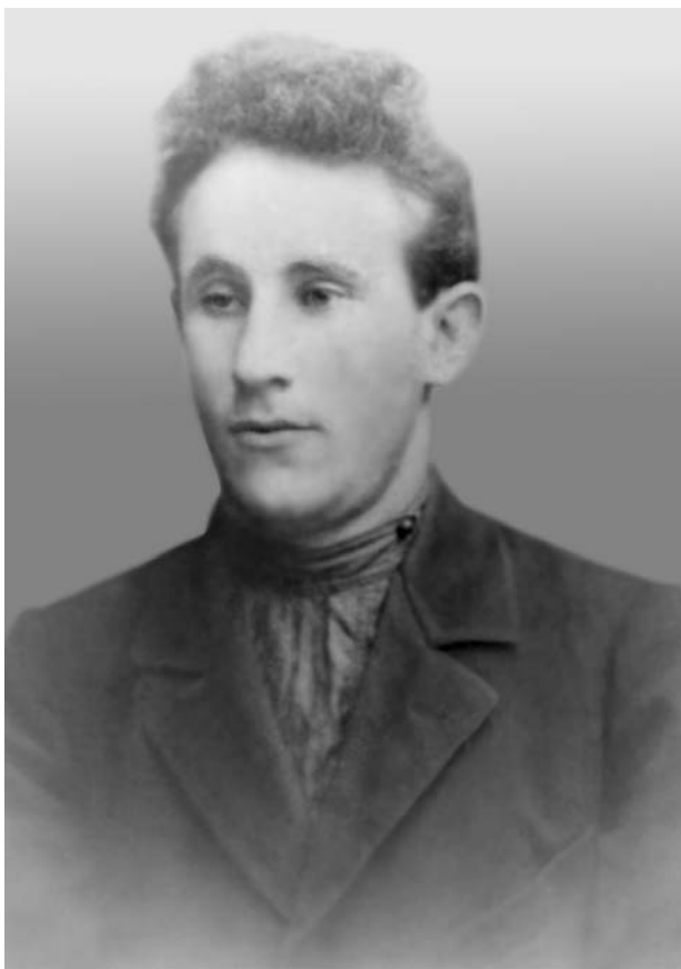
Абрам Иоффе (Деборин) 1900-е годы

Рукопись своей первой книги Деборин привез изерна Плеханову в Женеву. Плеханов внимательно читал и редактировал ее; стараясь издать, обращался с этим вопросом в журнал «Современный мир». Отказ журнала поместить статьи Деборина, подготовленные на