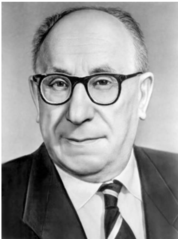
Абрам Моисеевич Деборин (1881–1963)

Путь А.М. Деборина к марксистской философии был типичен для интеллигента рубежа XIX — XX веков. Революционный кружок в училище, чтение нелегальной литературы, пропаганда среди рабочих, скитания по России, участие в демонстрации, арест, эмиграция. Оказавшись в Германии, Абрам Иоффе слушал в Берлинском университете крупнейших философов и экономистов того времени — Ф. Паульсе-