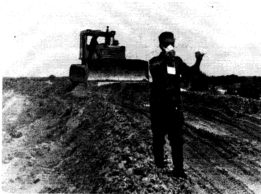
Прокладка подъездных путей к станции

— Слушай, перестань — нормальное масло! Мы все пробо- вали!