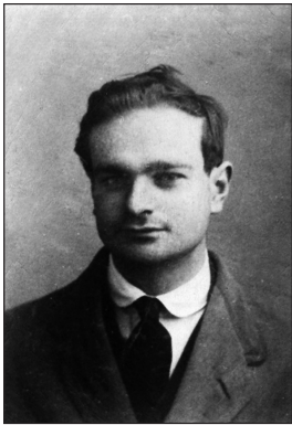
Б. М. Гессен