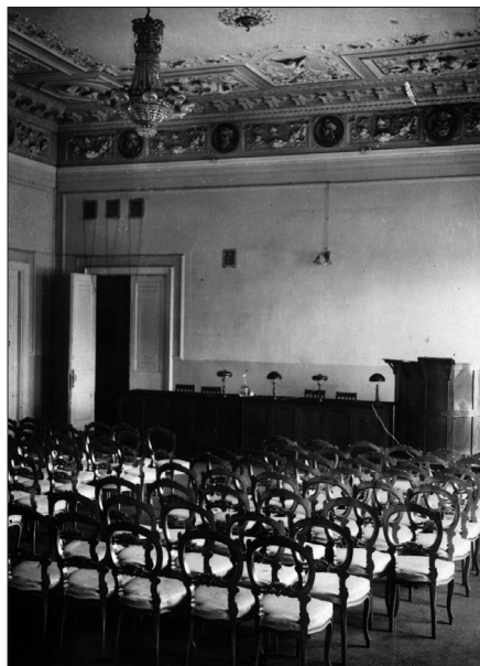
Москва, Волхонка, 14. Красный зал. 1931 г.

По мере усиления давления «сверху», извне, и превращения начетничества, склок и доносов в повседневность в философской среде происходило и человеческое размежевание изнутри. Суть процесса будет ясна, если мы присмотримся