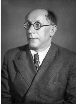
А. М. Деборин