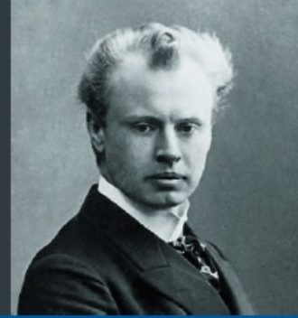
Философия права: П. И. Новгородцев, Л. И. Петражицкий, Б. А. Кистяковский