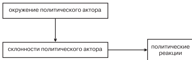
Рис. 1. Основные условия, предопределяющие политическое поведение: E \rightarrow P \rightarrow R .

лиза политики, признавая, что реакция человека (response – R) является производной от окружения (environment – E) и склонности (predisposition – P): E \rightarrow P \rightarrow R [55, 4-6]. В данном случае терминология опять используется на основе договоренности.