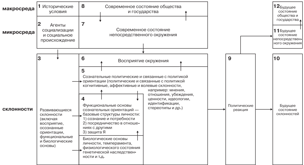
Рис. 3. Обобщенная схема для анализа личности в политике.

университетов превратилась в распространенную форму поведения, которая во время вторжения в Камбоджу в период администрации Никсона и убийства протестующих студентов в Кентском государственном университете охватила кампусы практически всех американских колледжей и университетов. Проводившиеся в то время исследования не выявили характерных особенностей протестующих [20, 171-181; 72].