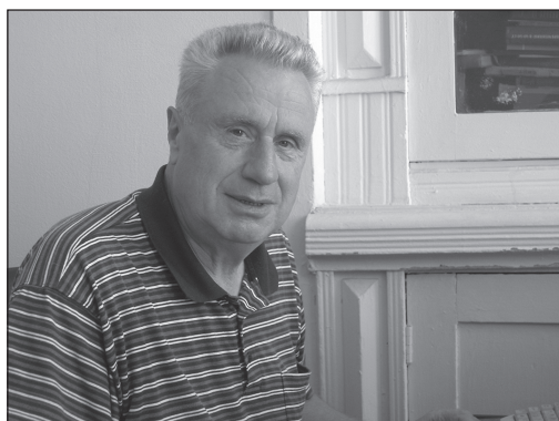
За работой. В личном кабинете ИФ РАН (4 июля 2006 г.)