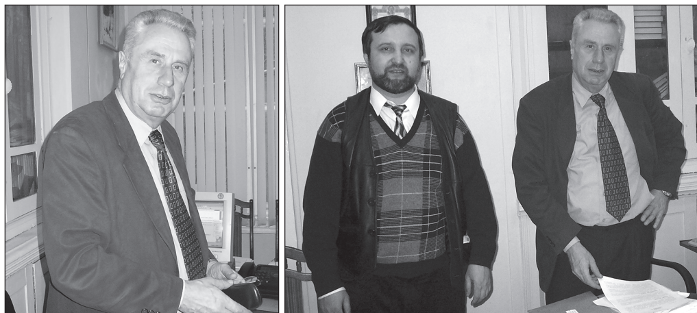
На редколлегии ЛКО в Институт человека РАН (10 февраля 2004 г.)