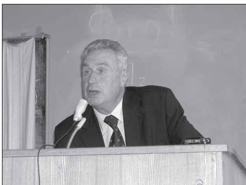
Презентация журнала «Личность. Культура. Общество» в ИФ РАН (20 апреля 2005 г.)