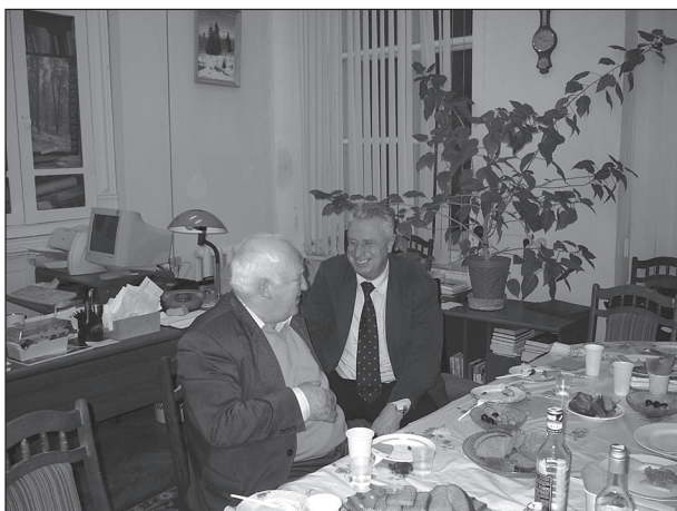
Семинар ЛКО в Институте философии РАН (1 февраля 2005 г.)