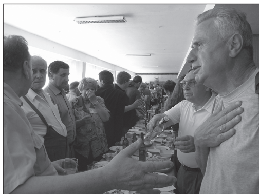
На Философском конгрессе в Москве (МГУ, 27 мая 2005 г.)