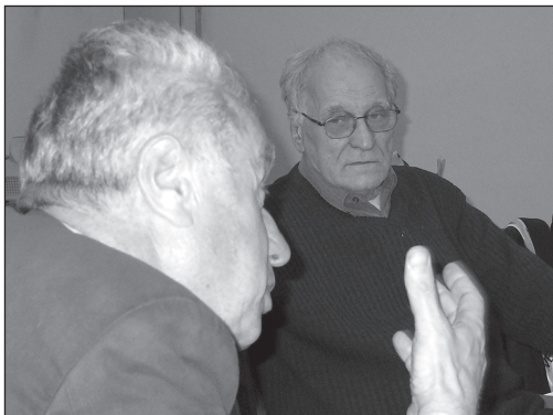
Семинар ЛКО в Институте человека РАН (2 июня 2004 г.)