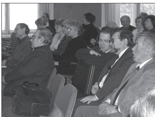
Юбилей журнала «Человек» в ИФ РАН (18 марта 2005 г.)