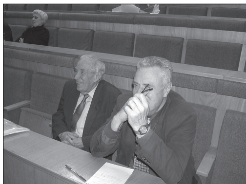
На конференции в РАНХиГС (Москва, 1 декабря 2006 г.)