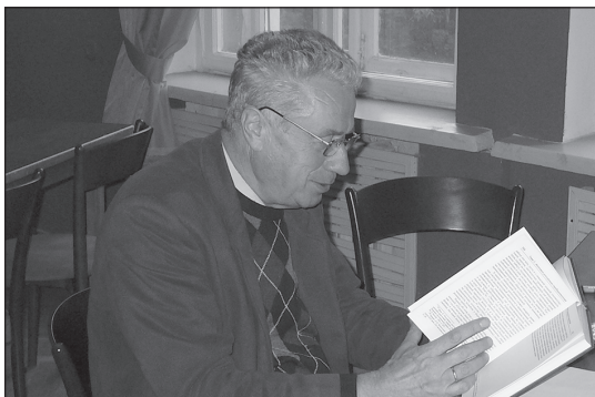
Встречи в Институте человека РАН (15 июня и 13 октября и 2004 г.)