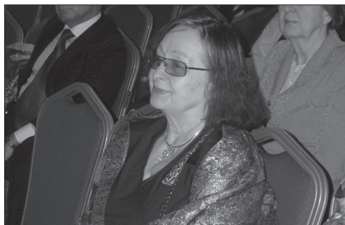
20.11.2009 г. Юбилейная конференция журнала «Личность. Культура. Общество» Российский институт культурологии (семинары)