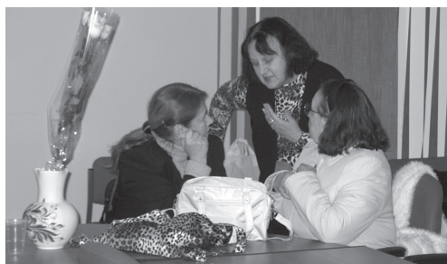
Институт философии РАН (семинары)