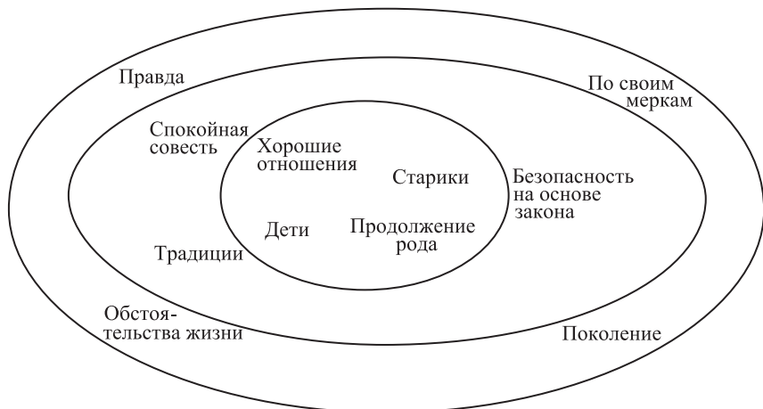
Рис. 1. Структура аспектов ценностной макропозиции «консолидированный гуманизм»

поколением, но при этом оценивать ее по собственным меркам (рис. 1).