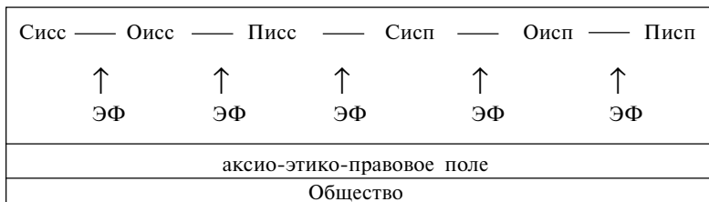
Рис. 1. Познавательно-прикладная деятельность в молекулярной биологии: Сисс – субъект, Оисс – объект и Писс – продукт исследования; Сисп – субъект, Оисп – объект и Писп – продукт использования результатов исследования; ЭФ – этический фактор.

Рассмотрим схему познавательно-прикладной деятельности в молекулярной биологии (рис. 1).