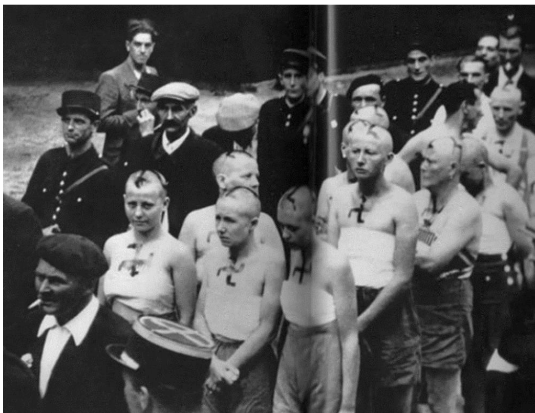
Рис. 2. Французских женщин, обвиненных в «горизонтальном коллаборационизме», проводят по улицам города. Их головы обриты наголо, а тела и лица отмечены свастикой.