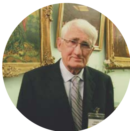
Юрген Хабермас Jurgen Habermas