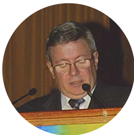
А.П.Торшин A. Torshin

Первый Заместитель Председателя Совета Федерации Федерального Собрания Российской Федерации (Россия).