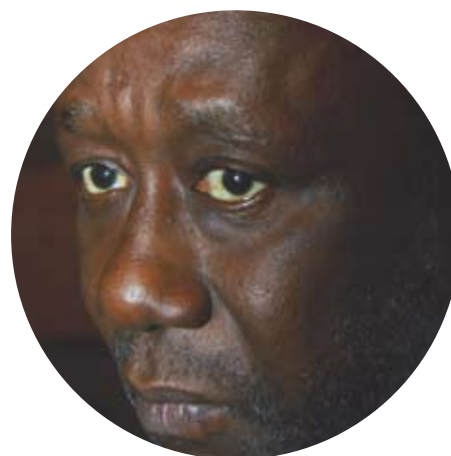
Пьер Сане Pierre Sané