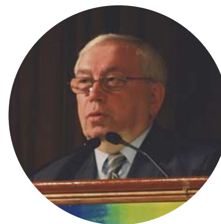
В.П.Лукин V. Lukin

Председатель Комиссии Совета Федерации по культуре. Член Комитета Совета Федерации по международным делам (Россия)