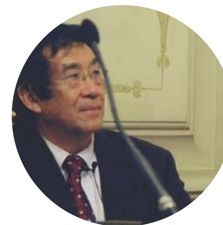
Веймин Ту Weiming Tu