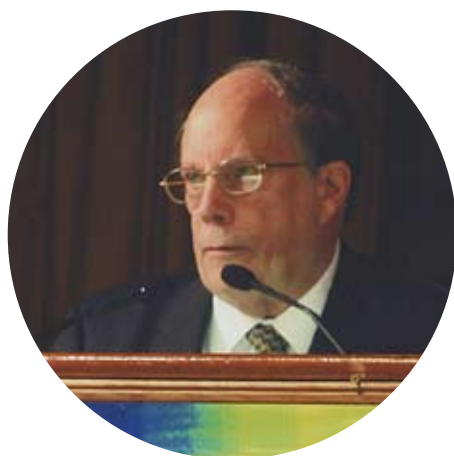
Вильям Макбрайд W.L. McBride Президент Международной федерации философских обществ (США)