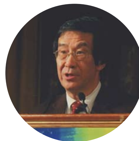
Профессор Веймин Ту Professor Weiming Tu (Китай)