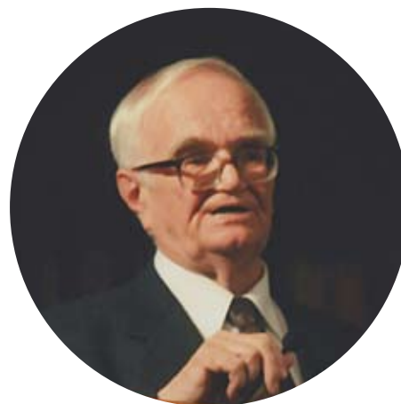
Академик РАН В.С.Степин Academician Vyacheslav Stepin (Россия)