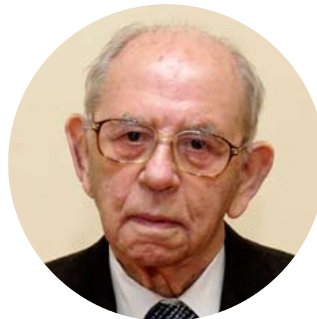
Т.И.Ойзерман Theodor Oisermann