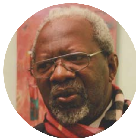
Паулин Хунтоджи Paulin J. Hountondji