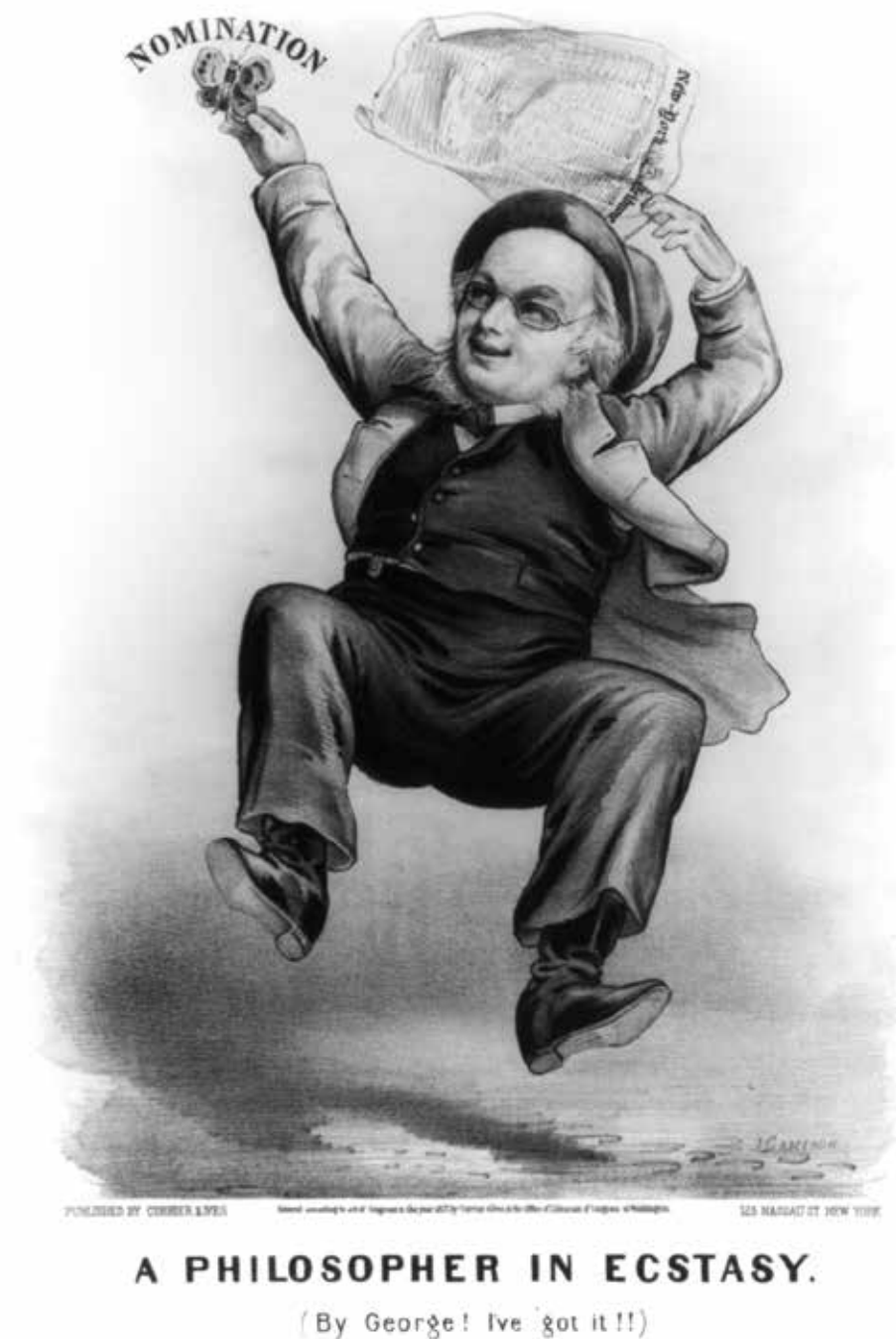
Джон Кэмерон. Философ в экстазе, 1828 г.

Специализированный номер журнала подготовлен в рамках гранта Президента РФ «Общественный статус ученого и наукометрическая оценка научной деятельности». При реализации проекта используются средства государственной поддержки, выделенные в качестве гранта в соответствии с распоряжением Президента Российской Федерации от 01.04.2015 № 79-рп и на основании конкурса, проведенного Фондом ИСЭПИ.