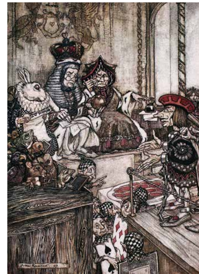
Кто украл пирожки? Судебный процесс над Валетом Червей. Иллюстрация Артура Рэксэма для книги «Алиса в стране чудес»

И.М. Я давно и пристально слежу за тем, что происходит. Похоже, что реформы — в частности закон об Академии наук — направлены на то, чтобы устранить те структуры, которые имеют наибольший авторитет и могли бы сказать своё слово при распределении средств на образование и науку. Академия была такой инстанцией, с ней были вынуждены считаться. Конечная цель в том, чтобы деньгами и на науку, и на образование можно было управлять, прислушиваясь к мнению тех «экспертных структур», голос которых покажется на тот или иной момент более слышимым. Большую свободу в распределении бюджета предоставит также перевод денег, выделяемых на науку, в разряд «конкурсного» финансирования. Претендовать на него сможет любой человек, вне зависимости от вуза или научного институ-