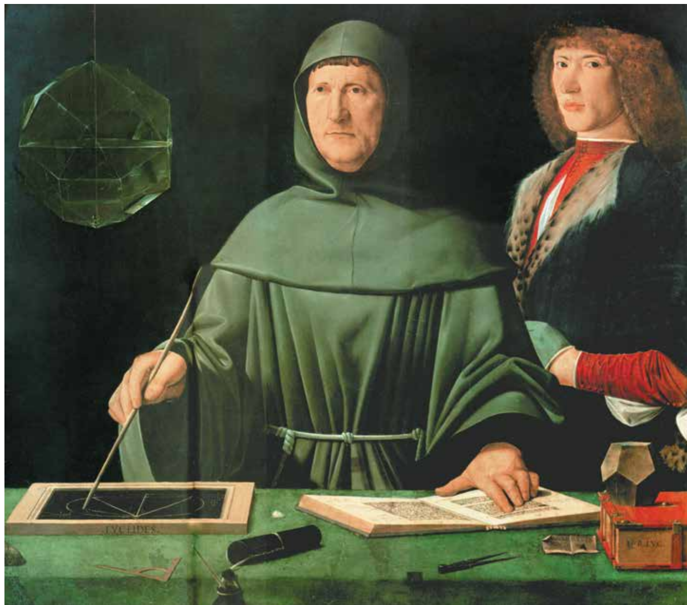
Якопо де Барбари. Портрет Луки Пачоли и неизвестного юноши, 1500 г.

становится, приобретает свое «лицо» издаваемый в нашем институте «Философский журнал». Интересные статьи публикует также «Вестник МГУ. Серия 7. Философия». «Логос» неплохой журнал, но он переоценен, на мой взгляд.