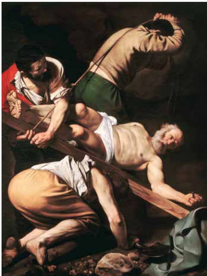
Караваджо. Распятие апостола Петра. 1600 г.

ская — якобы неэффективны. Вот тогда-то речь впервые и зашла об экспертной оценке. МГУ и ещё одна частная компания, Pricewaterhouse Group, ещё в 2011 году подавали заявки на проведение такой оценки по тендеру Минобрнауки. Естественно, МГУ проиграл. Победившей компании было поручено техническое задание составить т.н. «Карту науки» ( mapofscience.ru ). Была разработана система, в которой предполагалось подсчитывать количество публикаций в журналах Scopus и Web of Science, ВАК, участие в диссертационных советах, членство в международных организациях и т.д. Обещали, что данные из журналов будут автоматически подгружаться. Говорили, что, как только система заработает, нас будут по ней оценивать. Структура аргументации была такой: российская наука должна быть на передовых линиях мировой науки, а если так, то почему наших журналов и публикаций нет в мировых базах данных? Так и получилось, что зарубежные публикации были взяты в качестве «критерия качества». В каких институтах они есть, значит, там люди хорошо работают.