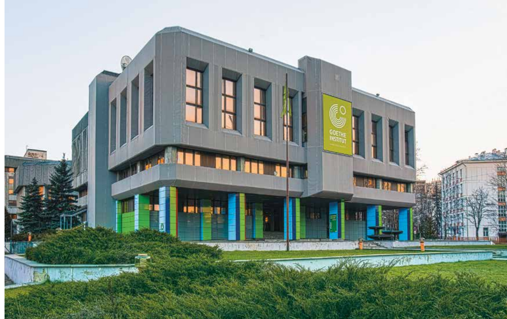
Гёте-институт в Москве.

Н.П. Насколько хорошо зарубежные коллеги знакомы с достижениями российских исследователей истории западной философии?