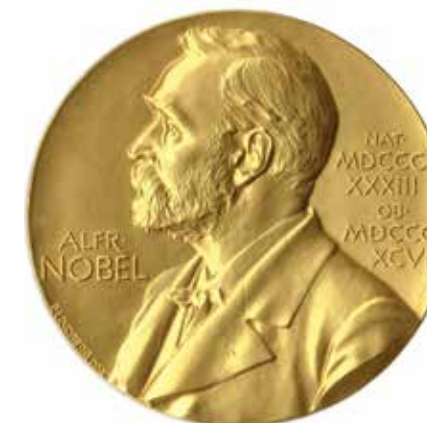
Медаль, вручаемая лауреату Нобелевской премии