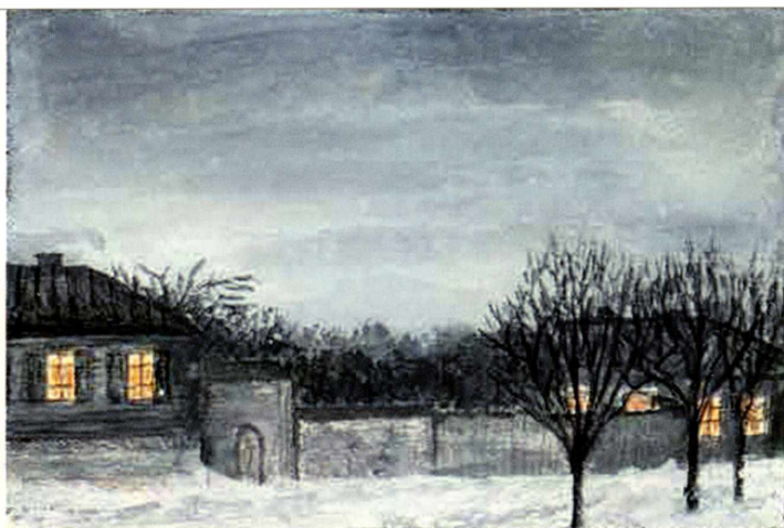
«Дневник закатов» Елены Кезельман очень любил и ценил Андрей Белый. Выставка открыта в Лебедянском краеведческом музее

и публицистические статьи, стремясь стать «понятным людям», отойдя от затемнённого, разорванного языка прежних лет.