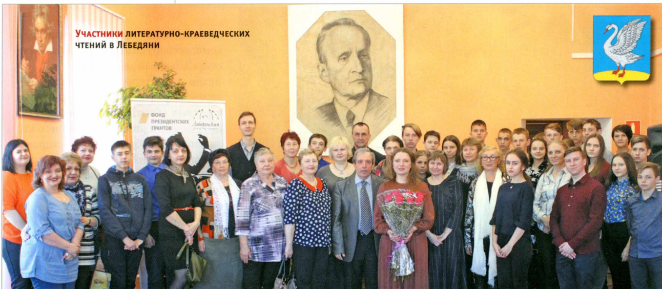
Участники ЛИТЕРАТУРНО-КРАЕВЕДЧЕСКИХ ЧТЕНИЙ В ЛЕБЕДЯНИ