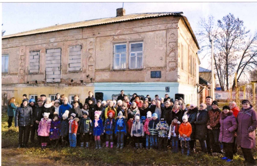
Дом, в котором жил Андрей Белый, пока ещё не приведён в порядок, но будем надеяться на лучшее