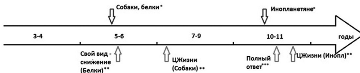
Рис. 1. Время формирования в онтогенезе стратегии поддержки жертвы, полного ответа, актуализации тем «Ценность жизни» и «Свой вид». Сверху: время формирования предпочтений (название дилемм); снизу: актуализация тем (название дилемм) и полнота ответа. *Сравнение групп по количеству предпочтений жертвы, критерий Фишера, p < 0,05 . ** Сравнение групп по частоте актуализации тем, Хи-квадрат, p < 0,05 . *** Сравнение групп по количеству полных ответов, Хи-квадрат, p < 0,05

в этом возрасте для выявления «запаздывания» необходимо использовать другую временную шкалу: не этапы онтогенеза, а «микроинтервалы» времени, соответствующие собственно выбору и генерации объяснения в рамках решения задачи эксперимента.