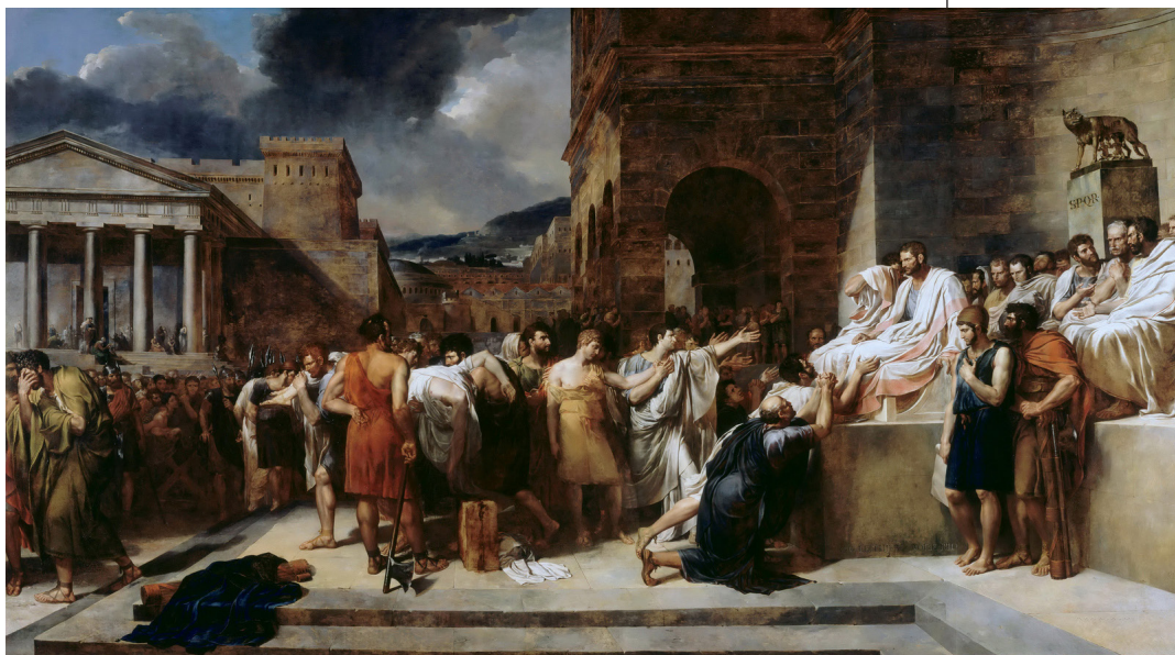
Рис. 2. Гийом Гийон-Летьер. Брут осуждает своих сыновей на смерть. 1788. Институт искусств С. и Ф. Кларк, Уильямстаун, США

А.В. Прокофьев Беспристрастность: анализ морального понятия