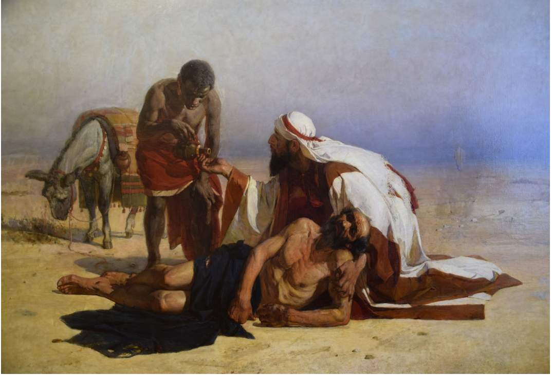
Рис. 1. Василий Суриков. Милосердный самарянин. 1874. Красноярский художественный музей им В.И. Сурикова

дей, затронутых последствиями действия, и обо всей совокупности различных воздействий на их безопасность, благосостояние, свободу и т.д. Именно в такой широкой перспективе моральный деятель стремится избежать влияния на свои решения индивидуальной заинтересованности и индивидуальных предпочтений (рис. 1).