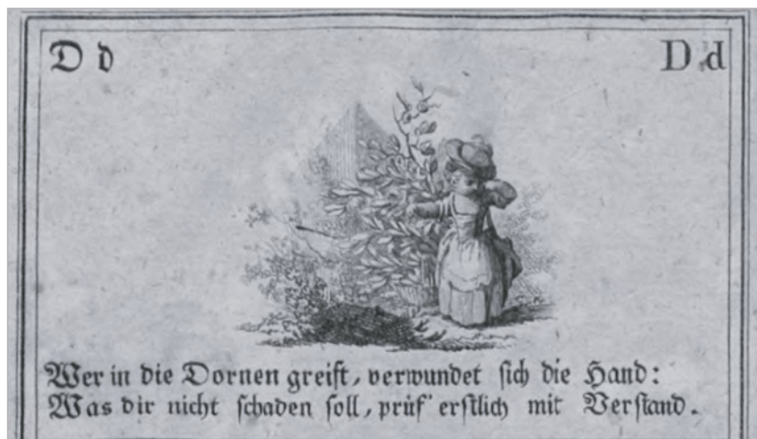
Девочка и терновый куст (Weiße Ch.F. Neues A, B, C, Buch. 1773)

поступков, которые могли быть как сиюминутными, так и отложенными во времени и даже перенесенными в относительно далекое будущее. За дурное поведение ребенок неминуемо расплачивается наказанием, которое может выражаться в форме причинения себе вреда (ушибы, порезы); порицания со стороны и взрослых, и сверстников; лишения провинившегося определенных прав (на десерт, игры, прогулки, общение со сверстниками); в различных формах психологического давления. В отдаленной перспективе даже единожды совершенный дурной поступок может привести к плохой репутации, к исключению из общества из-за ставшей чертой характера лживости и нежелания повиноваться (представителям власти, работодателю, др.), к нищете, которая выступает прямым следствием лени. Еще более драматичные последствия могут быть у тех дурных поступков, которые входят в привычку, поскольку во взрослом состоянии невозможно избавиться от приобретенных в детстве дурных склонностей. Так, мальчик из рассказа «Маленький притворщик» старался в присутствии взрослых вести себя примерно, но за их спиной предавался всевозможным шалостям. Эта двуличность так укоренилась в его натуре, что ему в жизни больше никто и никогда не доверял [36, с. 41–42].