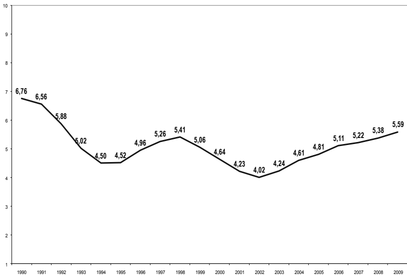
Рис. 1. Динамика композитного индекса психологического состояния российского общества в 1990–2009 гг. (в баллах)

В самой психологической науке аналогичные подходы реализуются при оценке субъективного качества жизни, психологического потенциала населения (Зараковский, 2009), социального капитала, по сути, имеющего социально-психологическое наполнение (Татарко, 2011), причем, как отмечает Г. М. Зараковский, «Принципиальным является переход от понимания сущности психологического потенциала индивида к пониманию сущности психологического потенциала социума» (Зараковский, с. 132).